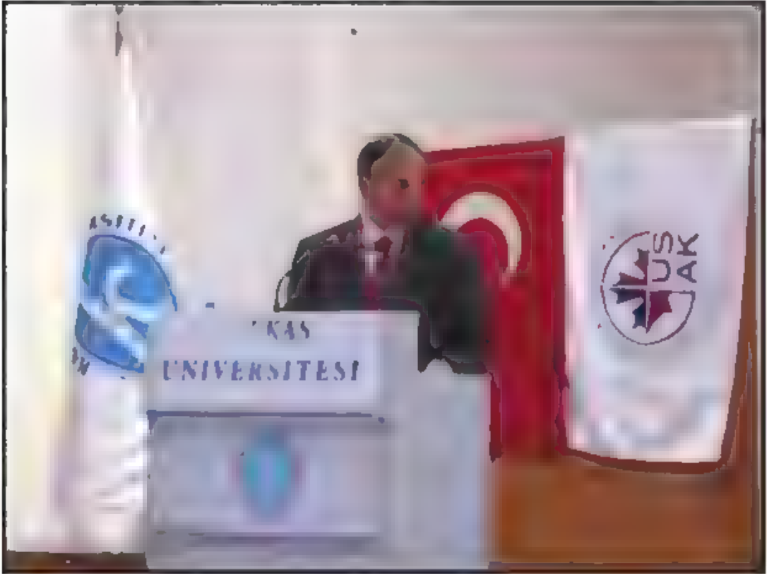
Em. Tümgeneral Armağan Kuloğlu